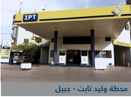
محطة وليد تابت - جبيل

من سياسات شركة أي.بي.تي. التوسع بمحطاتها في كل المناطق اللبنانية لتبقى قريبة من كل زبائنها وفي كل الأوقات. ولأن الهدف الأساسي تأمين الخدمة المثالية في كل محطات أي.بي.تي. فإننا نعمل على تجديد وتطوير المحطات القائمة بالتزامن مع إنشائها للمحطات الجديدة، وذلك لتوحيد صورة محطاتنا ورفع مستوى الخدمات فيها. من أحدث محطات أي.بي.تي. المجددة: