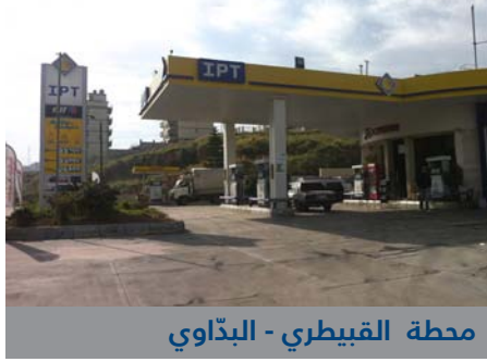
محطة القبيطري - البدوي