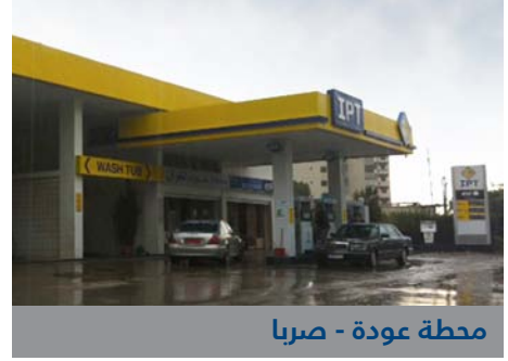
محطة عودة - صربا